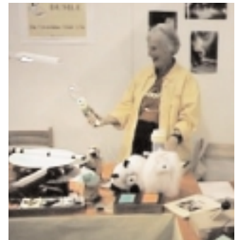
Att minnas namnet på en person.